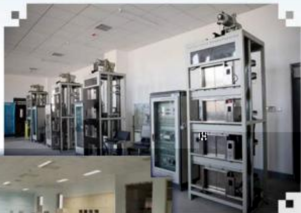
智能电梯安装调试 维护训练场所